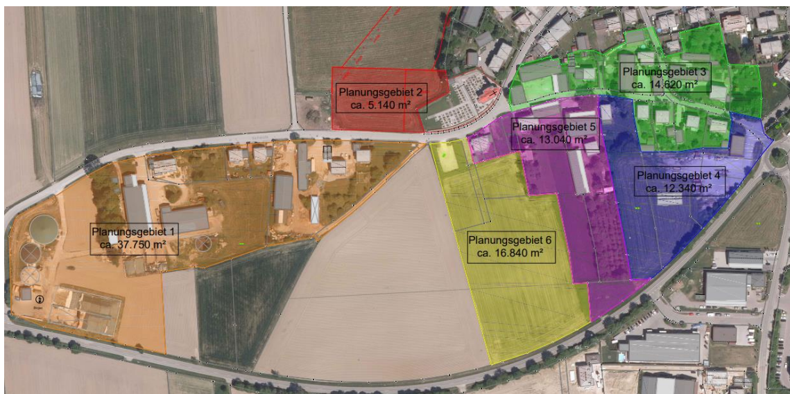
Abb. 2: Luftbild der Planungsgebiete

Das Vorhaben erstreckt sich auf einen etwa 10 ha großen, teilweise bereits bebauten Bereich im Westen von Pasenbach, der in sechs Planungsgebiete unterteilt ist (s. Abb. 2). Im Gebiet sind zahlreiche Gehölzbestände vorhanden, die beurteilt werden sollten.