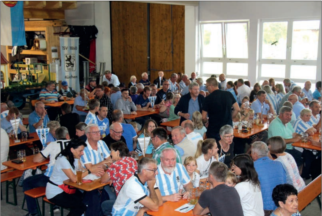
Viele Gäste in der Vereins- und Kulturhalle.