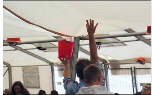
Immer wieder musste die Feuerwehr beim Zelt Dach Wasser ablassen.