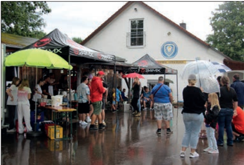
Besucher vor dem JUZ.