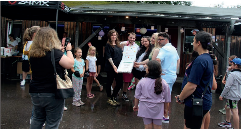
Geschenke für die Betreuer.