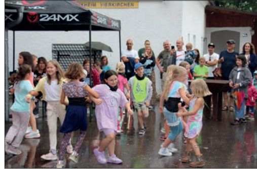
Die Babicorns beim Auftritt.