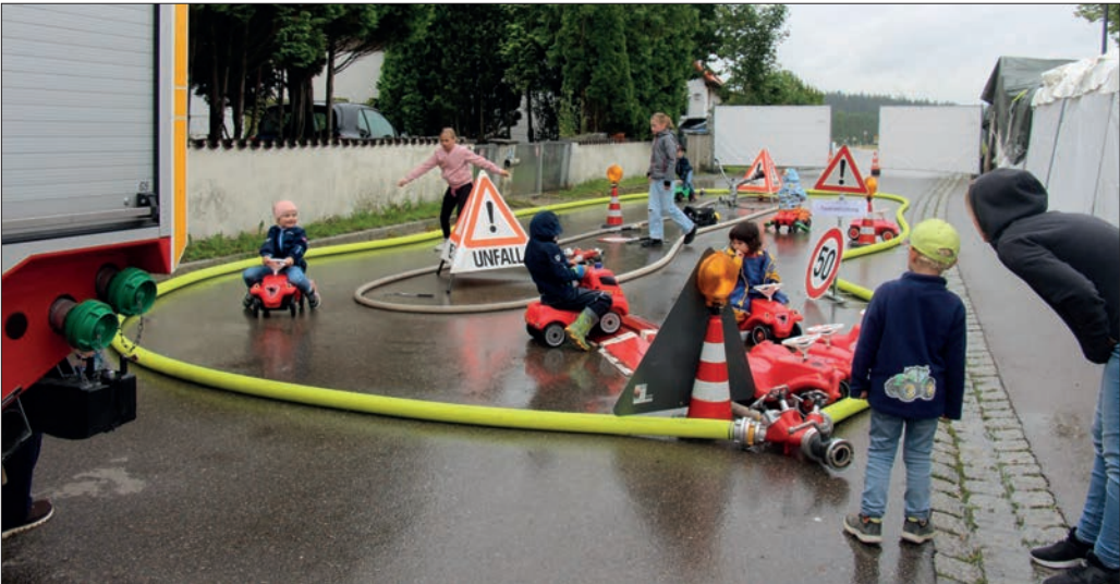
Trotz Regen eine Strecke für die Kinder.