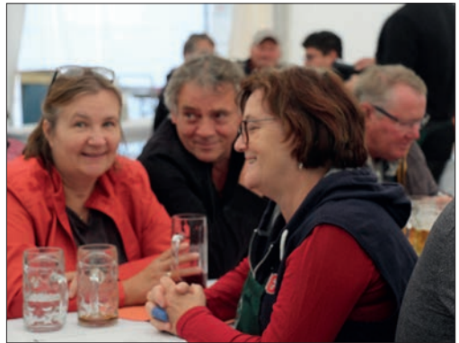
Besucher im Festzelt (Okt. 2023).