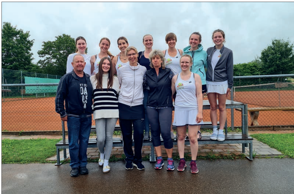
Das Damen-Team der Spielvereinigung Erdweg-Vierkirchen