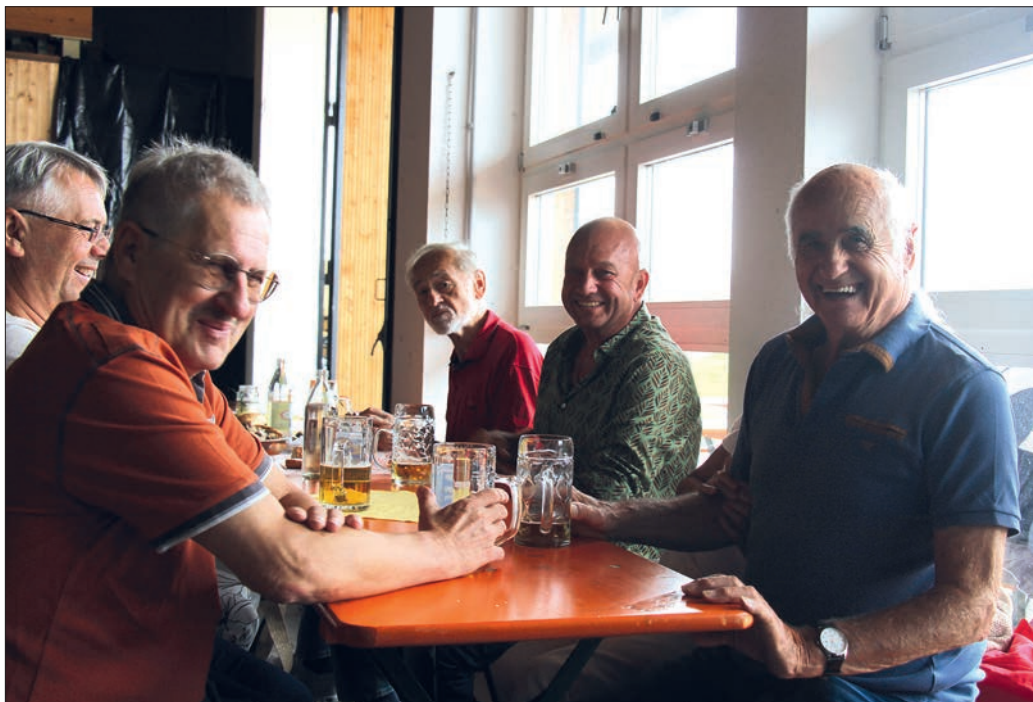
Besucher beim Dorffest.