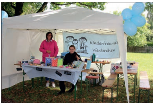
Verkaufstand der Kinderfreunde Vierkirchen.