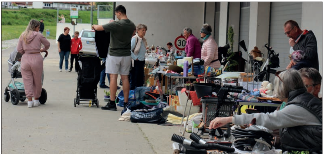
Flohmarkt im Frühjahr.