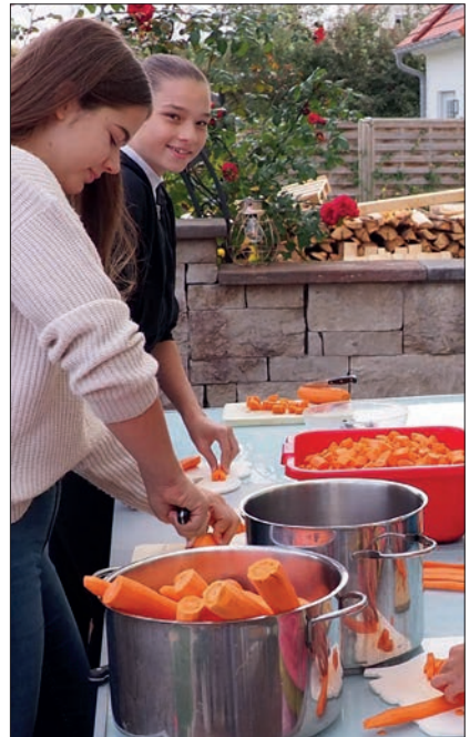
Fleißige Helfer für die Erntedanksuppe des letzten Jahres schälten und würfelten eimerweise Kartoffeln, Zwiebeln, Karotten und Kürbisse.

Die Minibrote der KLJB gibts übrigens in Vierkirchen auch am Samstag, 5. Oktober nach dem Vorabendgottesdienst um 17 Uhr.