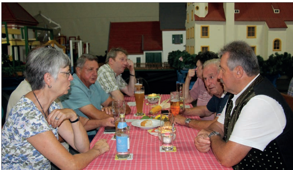
Besucher beim Herbstfest.