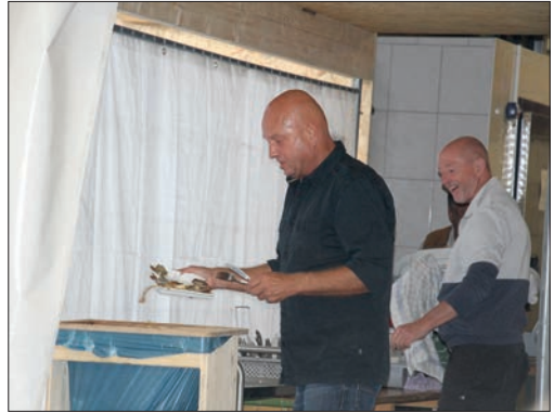
Selbst der Chef hilft beim Fischerfest (Okt. 2023).

Eine Woche später, am 20. Okt., hält der Fischereiverein seinen Herbstflohmarkt ab. Von 9.00 bis 16.00 Uhr wird dort zum Stöbern, Handeln und Kaufen eingeladen. Für Speisen und Getränke ist ebenfalls gesorgt so werden z.B. Steckerlfisch angeboten. Für eine Standgebühr von 5,- Euro können die Stände ab 8.00 Uhr aufgebaut werden.