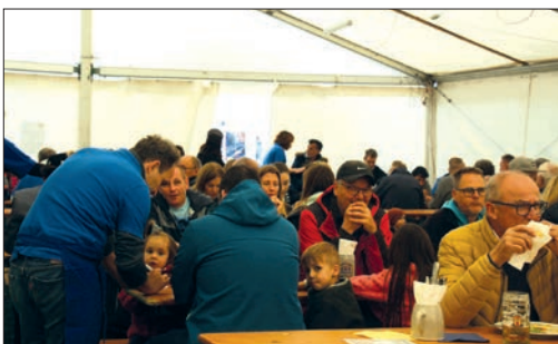
Viele Besucher im Zelt.